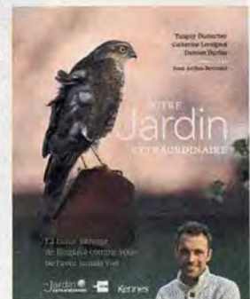
La faune sauvage en Belgique comme vous ne l'avez jamais vue.